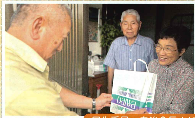
民生委員 自治会長より受け取られる在宅高齢者様