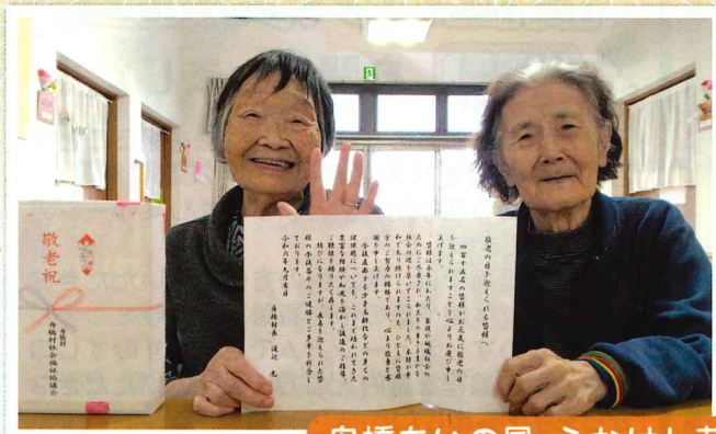
舟橋あいの風・ふなはし荘にて受け取られる入所者様