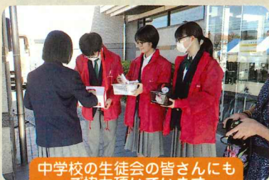
中学校の生徒会の皆さんにも ご協力頂いています

「自分のまちを良くするしくみ」赤い羽根募金運動は10月～12月まで行っています。 皆様のご協力をお願い致します。